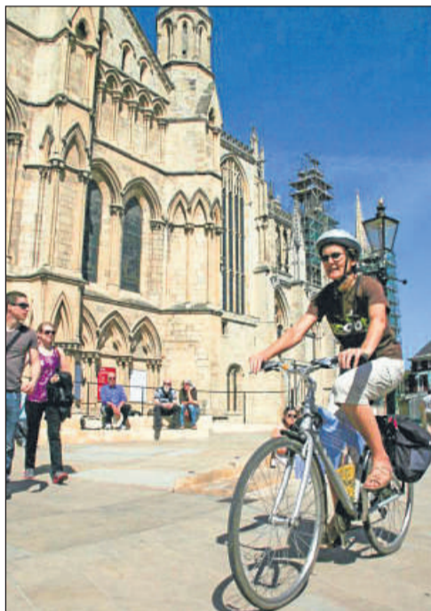
Entspannte Rundtour: Vorbei am Minster von York, Englands größter mittelalterliche Kirche.

Wir sind froh, dass wir uns die enge Landstraße B 6270 mit nur wenigen anderen Radfahrern und ein paar Autos teilen müssen. Im weiten Tal von Swaledale radeln wir durch eine hügelige englische Bilderbuchlandschaft. Schafe weiden auf sattgrünen, von Feldsteinen begrenzten Wiesen. Bekannt wurde der malerische Landstrich durch die Geschichten des Landarztes und Schriftstellers James Harriot, die als Vorlage der BBC-Serie „Der Doktor und das liebe Vieh“ dienten.