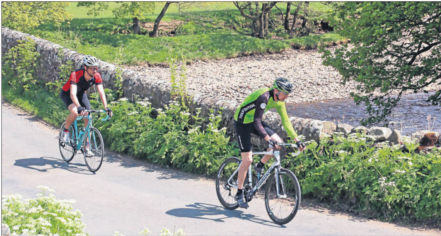
Mit dem Rennrad durch das Tal von Swaledale: Wo an diesem Wochenende die Tour de France-Fahrer alles geben, kommen auch ambitionierte Freizeitradler auf ihre Kosten.